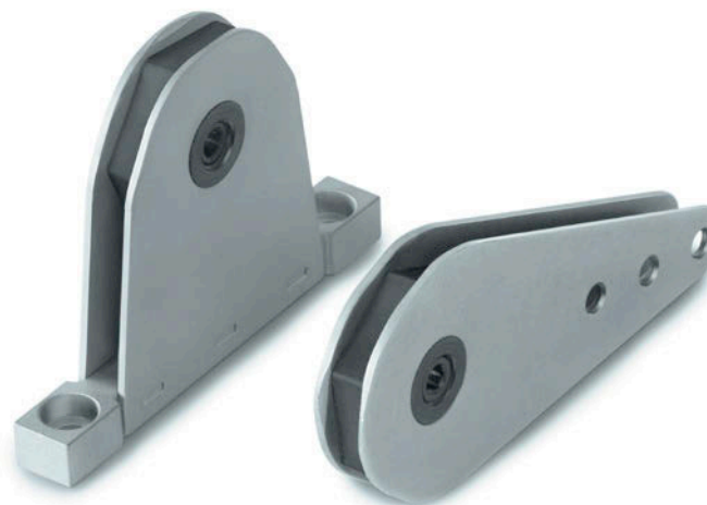
DRC 1E Versão em material composto