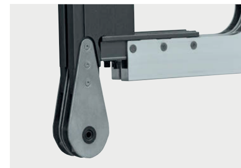
DRC 1E Elemento de acionamento no suporte lateral