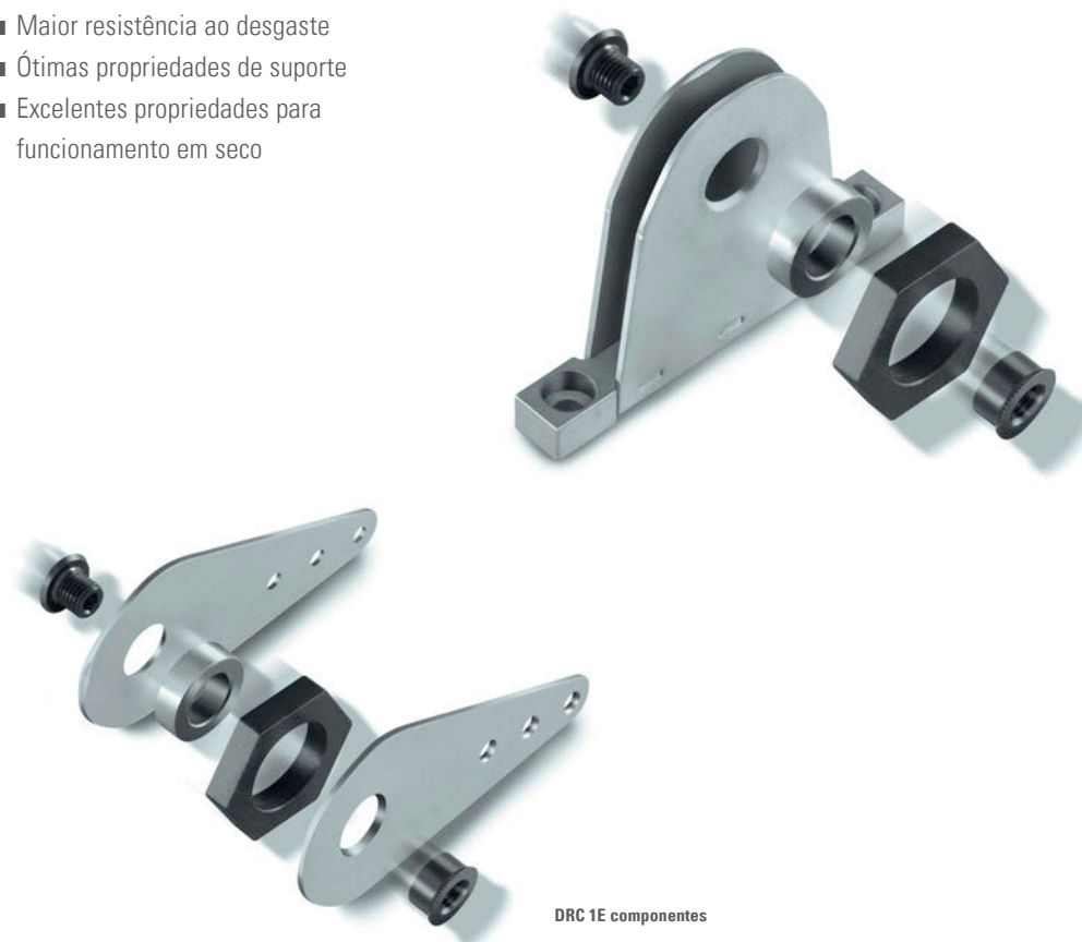
DRC 1E componentes