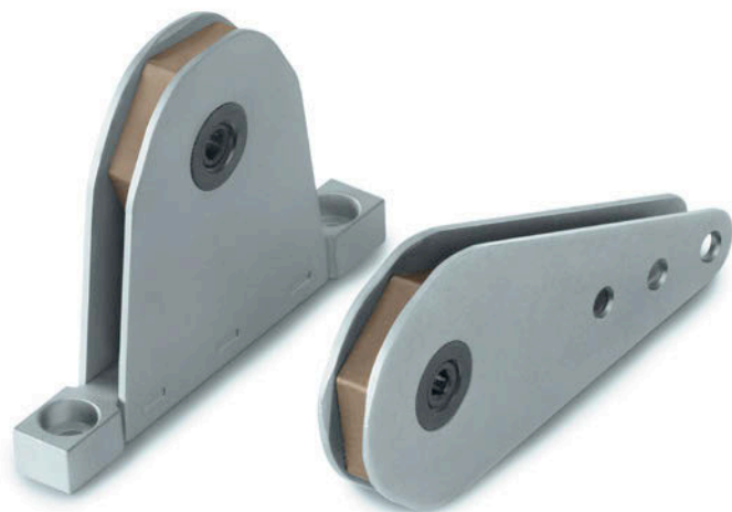
DRC 1E Versão em bronze