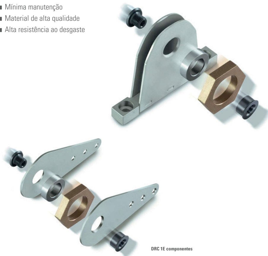
DRC 1E componentes